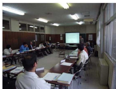
(左) 第5回川内村教育環境整備検討委員会