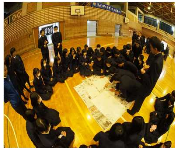
避難所運営のシミュレーションの様子