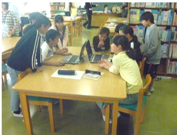
ノートパソコンで図書館の蔵書を検索や予約ができる