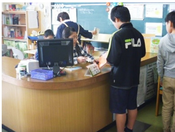
学校図書館のカウンターで、予約した市立図書館の本を受け取る