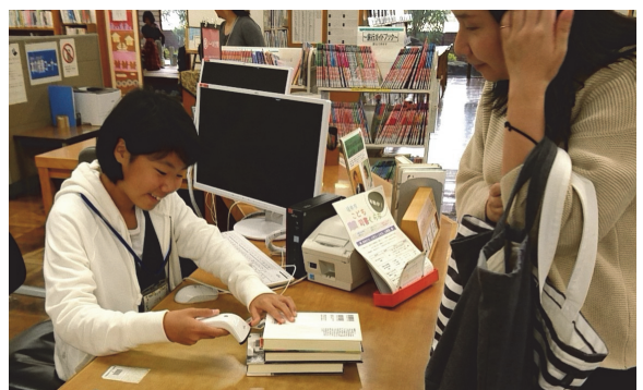
福井市 こども司書くらぶ