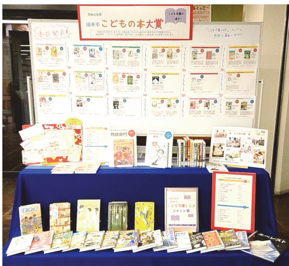
福井市 こどもの本大賞