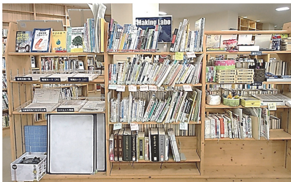
授業用文具等のコーナー