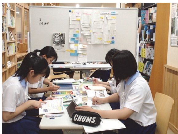
探究応用文系学習風景