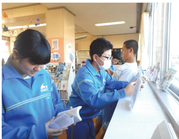
図書館に来て、気になる本を読む生徒たち