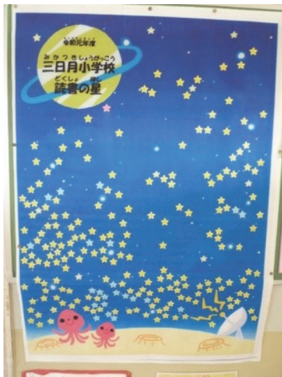
「一人100冊運動」読書の星