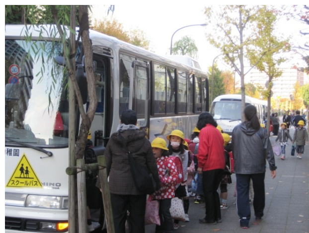
写真4 スクールバスによる通学風景（東京都江東区）