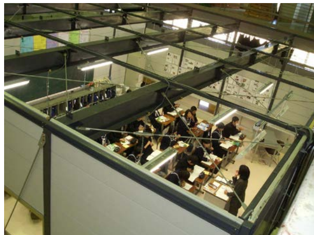
写真2 体育館を普通教室として活用 (富山県砺波市)