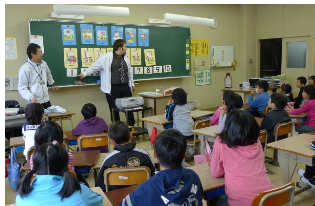
写真3 1クラスに2名の教員がいる授業風景（宮崎県五ヶ瀬町）

仮設校舎を建設した場合と比較すると経費削減の点で有利であり、効率的に工事を行うことも可能です。さらに、工事期間中の学習環境の面で大きなメリットがあります。