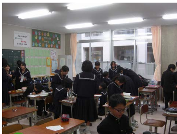
写真1 ピロティを普通教室等として活用 (富山県砺波市)

ら5割削減できました。また、仮設校舎の用地の確保が不要になるほか、工事量の減少に伴い工事期間も短縮できました。