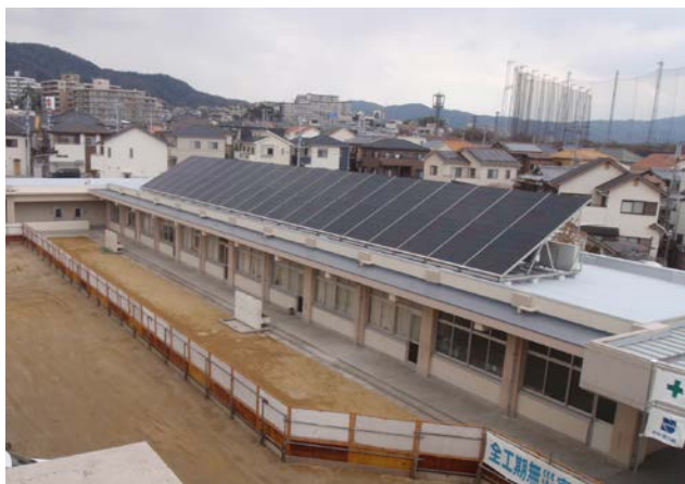
図2 減築後の1階建て校舎