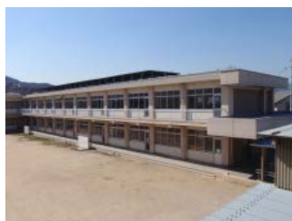
図1 改修前の2階建て校舎

1階建てとしたことで、建物が軽量化され耐震性能が上がり、補強箇所が少なくなりました。長期的には、建物の維持管理費の抑制と将来の解体費の抑制が見込まれます。