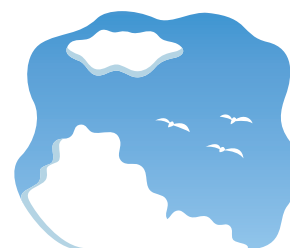
空気から 0.6ミリシーベルト