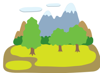
地面から 0.4ミリシーベルト