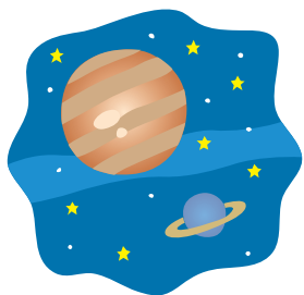
う ちゅう 宇宙から 0.3ミリシーベルト