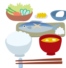
食べ物から 0.2ミリシーベルト