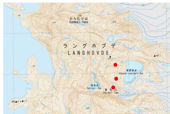
図 ドラム缶が確認された位置（赤丸）