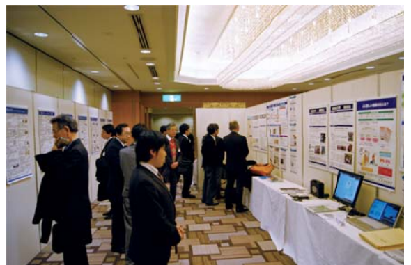
首都圏西部 シンポジウム2014 展示コーナー