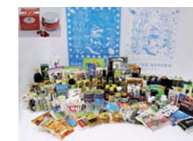
開発された商品群