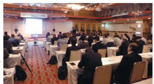
平成25年2月12日開催 研究成果報告会

(ホームページ参照 http://www.ehime-iinet.or.jp/inove/ )