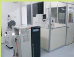
テーマ① 微粒子ピーニング装置