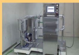
テーマ② 液状食品金属検査装置