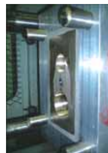
電鍍金型(コンセプトモデル)

また、エポキシ樹脂成形プロセスにおける金型への離型処理技術では、フッ素含有トリアジンチオールにより離型被膜処理を行うことで、離型剤レスの高耐久性離型機能を実現した。さらに凹凸の複雑表面への均一な離型被膜形成技術の確立により、フレネルレンズ用金型などの複雑微細形状金型やLSI封止金型への適用が図られた。