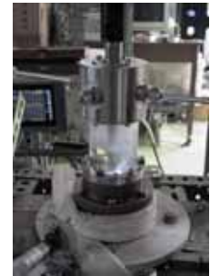
高周波液中プラズマ発生装置

安定した液中プラズマ発生のための高周波回路を設計し、等価回路を決定した。これによって、プラズマインピーダンスのモデリングが可能となり、エネルギー効率の高い安定したマイクロ波および高周波プラズマ化学反応炉が製作された。本装置は、液体の種類によらずプラズマを発生できるため、環境問題として懸念されているフロンやダイオキシン、PCBなどの有害物質を従来以上の効率で分解し無害化することが可能である。