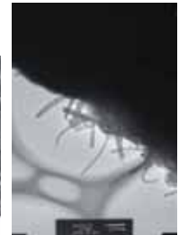
カーボンナノチューブ TEM写真