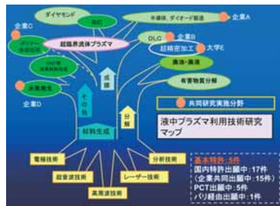
液中プラズマ利用技術研究マップ

愛媛大学では、工学部、理学部、農学部、総合研究支援センターの協力のもとに、液中プラズマ利用技術研究プロジェクトが設立され、液中プラズマプロセス、ソノプロセス、レーザー計測技術の研究開発が進められている。また、1大学4社との共同研究を推進し、液中プラズマ装置の開発、成膜技術の高速度大面積化および半導体製造の開発に取り組んでいる。これまでに、3件の国内特許、1件の米国特許、韓国特許を取得した。都市エリア終了後も多数の特許を出願している。