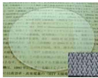
反射防止構造 (パターン部50mm×50mm:三洋電機製)

低反射な光学部材を超精密成型によって作製する技術を確認した。ナノ構造を表面にもつ金型を使って光学樹脂を成型することで、光の表面反射率が可視光全域にわたって1%に低減された光学部品を作製することに成功している。これにより、従来の誘電体多層膜による反射防止処理が不要となり、高性能な光学部品が安価に得られるようになった。デジタルカメラ等の光学レンズとして利用することで、画質の向上などが期待される。