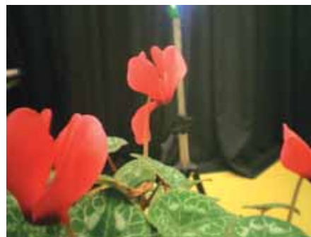
表面無反射構造レンズを用いた撮像写真、 コニカミノルタテクノロジーセンター提供

金属表面への直接微細加工によって、電鍍技術を用いない金型作製技術を確認した。これによりレンズ表面の曲率精度を向上させるとともに、金型の作製コストが低減された。一方、平成18年度からNEDO事業(次世代光波制御材料・素子化技術プロジェクト)において、耐熱性や耐光性に優れたガラスを素材としたナノ構造の作製技術開発に取り組んでいる。高品質デジタルカメラ、液晶プロジェクタ、青色レーザ光学系などのガラス光学部品を実現する。また、本技術の普及を目指して、試作品の提供や技術指導等のサービスを各企業に実施している。