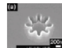
金型を用いた成形結果のSEM観察像