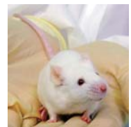
免疫系ヒト化マウス

免疫関連難治疾患のオーダーメイド治療を可能にするため、アレルギー疾患や癌の免疫細胞治療の治療効果や予後を予測するバイオマーカーを同定し診断キットの開発を目指す。