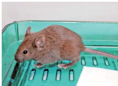
MACベクターを保持するマウス

これまでに染色体工学技術によるヒト人工染色体 (Human Artificial Chromosome : HAC) 技術を展開し、遺伝子導入用ツールとしての応用が期待される HACベクター技術を確立した。このHACベクター 注1) 技術を応用し、ヒトの薬物代謝酵素として代表的な CYP遺伝子 注2) を導入したモデルマウスの作製にも成功した。しかし、HACベクターは、マウス細胞においては必ずしも安定ではないことが明らかとなってきた。