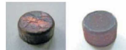
銅メッキとフェライトメッキ