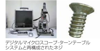
デジタルマイクロスコープ・ターンテーブルシステムと再構成されたネジ