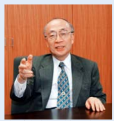
財団法人 先端医療振興財団 理事長、 京都大学総長、 神戸市立中央市民病院長、 総合科学技術会議議員を歴任