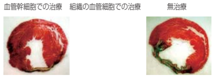
血管幹細胞での治療 組織の血管細胞での治療 無治療 改善あり 改善なし 3. 血管内皮前駆細胞を用いた再生医療の事業化

血液中の細胞から血管の基になる細胞(EPC)を分離、増殖することに成功しました。EPCを用いて、血液の通わなくなった下肢などを治療する臨床研究を行い、好成績を得ています。この技術を基に、StemMed株式会社を設立し、再生医療のさらなる発展に取り組んでいます。