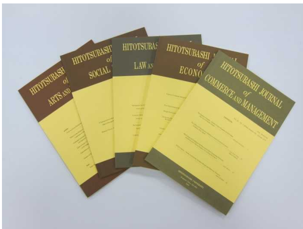
一橋大学が発行している欧文紀要 「一橋ジャーナル」5誌

一橋ジャーナルは、一橋大学機関リポジトリにて全文公開を行っていますが、第3期中期計画に基づいて、国際発信力をより一層強化するため、国際的評価の高い海外論文データベースへの登載に向けた取組を進めています。