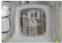
土踏まず部分にはシューズの脳として、1秒間に500万回の計算が可能なマイクロプロセッサを内蔵。このシューズのためにプログラミングされたソフトウェアが、ミッドソールの硬軟度を調節。

彼女とのアウトドアデートを楽しむときも、このシューズを履いていけばカッコイイところを見せられるかも!?