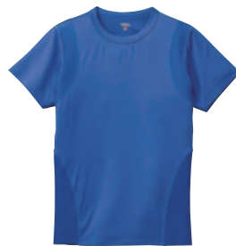
汗をかいてもすぐに乾くドライ効果あり。

アンダーウェアひとつでその日の気分は変わるもの。そればかりか姿勢、疲労度まで変わるって知ってた? そんなアンダーウェアと体との関係をユニクロと慶應義塾大学が共同研究。体の各部分の動きにあわせ、ストレッチ度合いの異なる生地を使ってみられたのが「ボディテック」だ。たとえば肩甲骨付近にはテーパー効果のある生地を使用。本来はスポーツ用として開発されたものだけれど、彼女と部屋でくつろぐときにちょうどいい一枚になるかも。