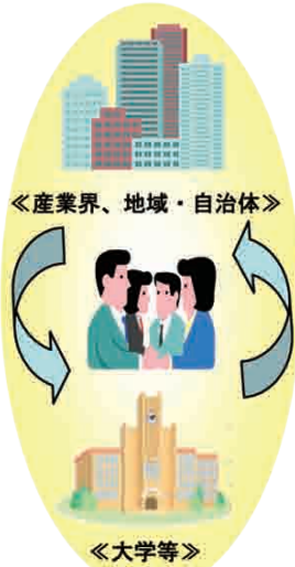
産学官連携コーディネーター数と活動実績の推移

研究開発マネジメントや新技術の事業化などに関する知識や実務経験を有し、企業ニーズと大学シーズのマッチングや産学官共同プロジェクトの企画・調整など、企業・地域社会と大学との橋渡し役を務める専門人材(産学官連携コーディネーター)による大学等への支援を実施する。