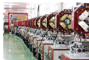
先端加速器試験装置