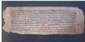
リグヴェーダ(古代インドの聖典)