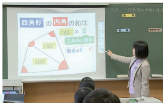
中学校 2年 数学科