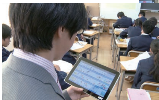
中学校 2年 社会科