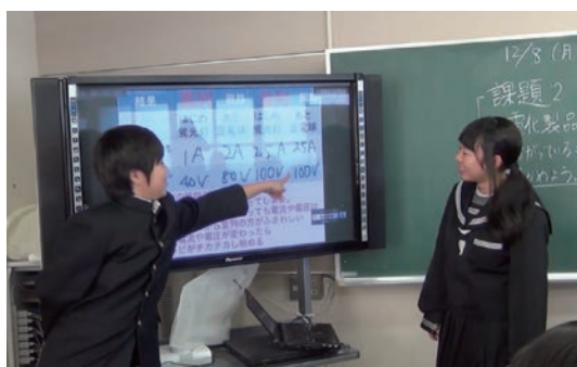
中学校 2年 理科

タブレット端末を思考のツールとして活用するには、拡大や縮小をして何度も繰り返し書き直しながら考えることを日常化し、不慣れなために思考が妨げられることがないようにすることが必要です。また、タブレット端末は、家庭や地域の自然現象等を撮影して、学習の場に持ち込むのに最適のツールです。