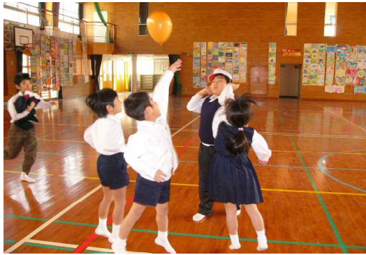
昼休みの風船バレー