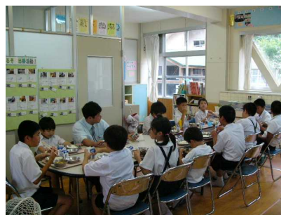
特別支援学級で給食を一緒に食べる子どもたち

さらに、特別支援学級の子どもが、通常学級の子どもに教室内の教材・教具等について説明するような機会も生まれました。