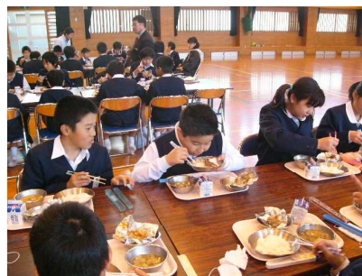
広々とした体育館で交流給食を楽しむ子どもたち

3学期に、5年生以上の全学級を対象とし、広々とした体育館で毎日1学級ずつと交流給食を実施しました。配膳から後片付けまで、特別支援学級と通常の学級の子どもたちが一緒になって行いました。