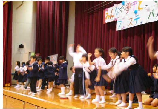
全校の前で歌とダンスの披露

また、「特別支援学級の友達と一緒に遊びたい。一緒に参加したい」という通常の学級の子どもたちの気持ちが高まり、みんなで楽しむことができる風船バレー大会を計画したり、総合的な学習の時間に特別支援学級の子どもたちと一緒に全校の前で歌とダンスを披露したりして、互いの理解を一層深めることができるようになりました。