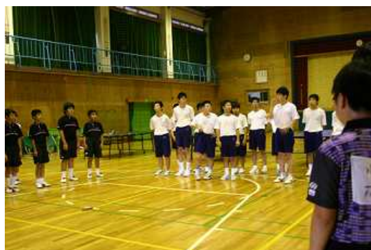
3校合同での部活動交流

本校卓球部は、15年前までは全国聾学校卓球大会（以下、「全国大会」という。）で何度も優勝した強豪校でした。その後も何度か全国大会に出場しましたが、入賞するまでには至っていません。これまで部活動を充実させるために、地域と連携し、市民クラブや卓球協会のメンバーの方に指導をお願いしたこともありました。