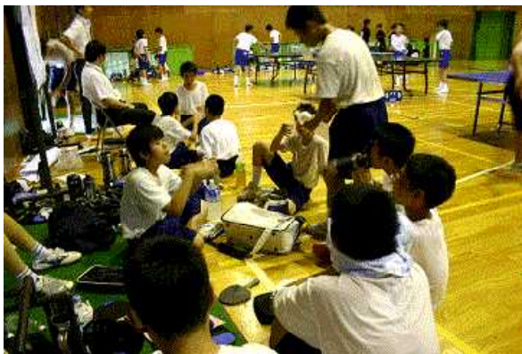
休憩中の話し合い

部活動を通じた交流及び共同学習は、特別支援学校、中学校共にメリットがあります。中学校の生徒は、相手校の生徒が特別な存在ではないと実感することができ、特別支援学校の生徒は地域とのかかわりが深まり、社会性を培うことにつながります。身構えて、「何かを得るために交流及び共同学習を始める」のではなく、「交流及び共同学習を始めてみることで、障害の有無にかかわらず生徒同士の理解が深まることにつながっていく」ことがあるのではないかと思います。