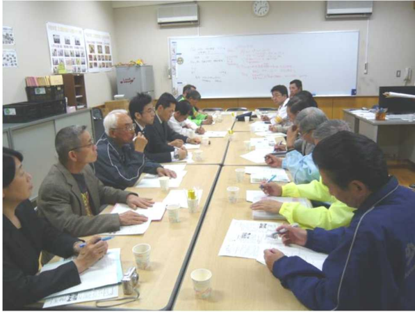
安全支援コミュニティ会議 (地域・保護者・交番の参加)