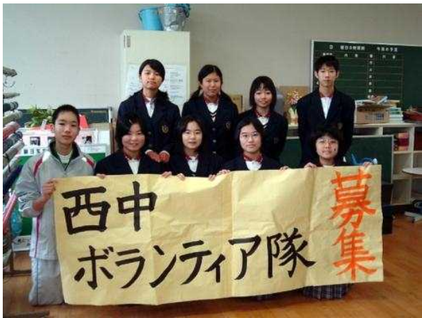
ボランティア隊の組織 (地域への貢献活動)