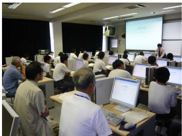
星雲タイム (大人参加型授業)