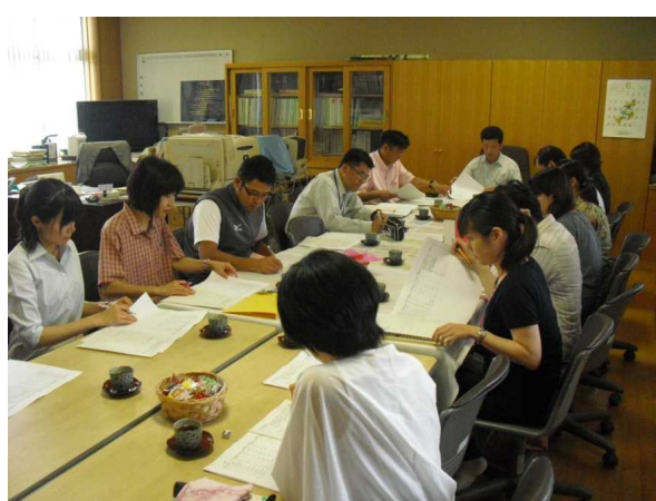
拡大教育相談委員会 (不登校への対策)