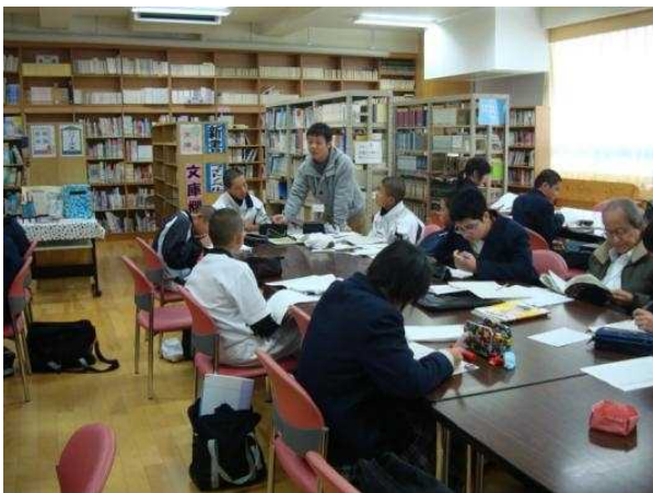
土曜星雲塾 (地域主催の学習会)