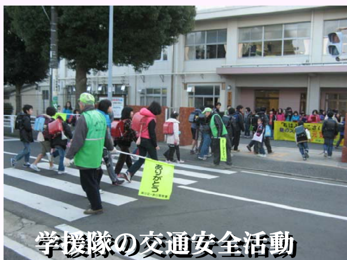
学援隊の交通安全活動

学校運営協議会とその活動部会の活動によって学校を取り巻く地域の連携が急速に進みました。 ○開かれた学校へ！地域の声を学校へ！ 学校の声を地域へ！ ○地域と共に！学校と地域の連携による相乗効果！