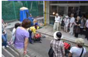
今年度の避難所宿泊訓練のようす