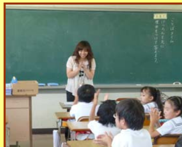
「ことばタイム」～考える習慣化