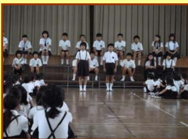
「集会活動」～高学年がお手本