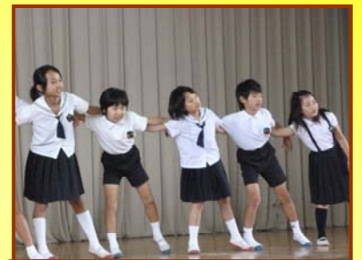
表現する喜び～音楽・図工・体育