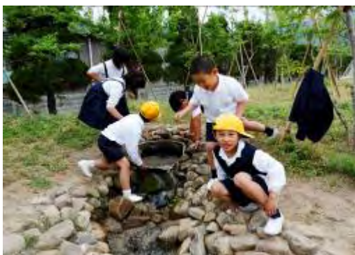
(ビオトープで遊ぶ子どもたち)