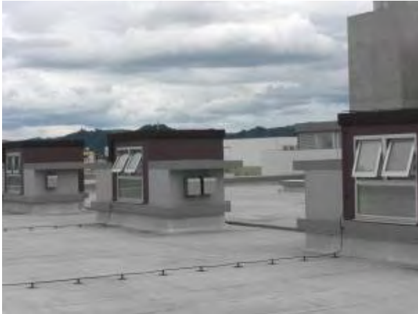
(自然換気システム)