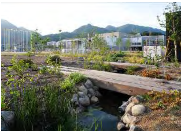
(府中小学校 ビオトープ)