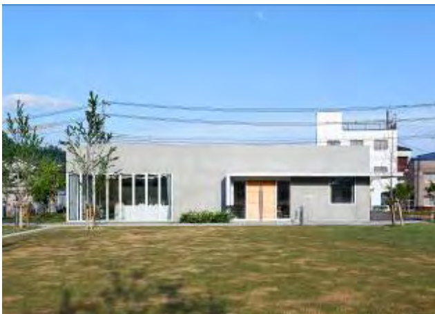
(府中小学校 芝生グラウンド)