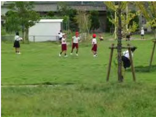
(芝生グラウンドで遊ぶ子どもたち)

・学校のグラウンド芝生化や、ビオトープの施工により、体感温度を下げるだけでなく、子どもの遊び場としても有効に利用されている。