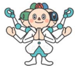
大学マスコットキャラクター 「NASURA」（ナズラ）

キャラクターの選定に当たっては、国内外に向けてキャラクターの公募を行い、オープンキャンパスでの一般市民による投票や学生・教職員による投票を経て決定し、本学が推進する先端科学技術分野（情報科学、バイオサイエンス、物質創成科学の 3 つの研究分野）を地元奈良の興福寺等で知られる阿修