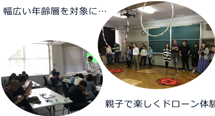
親子で楽しくドローン体験