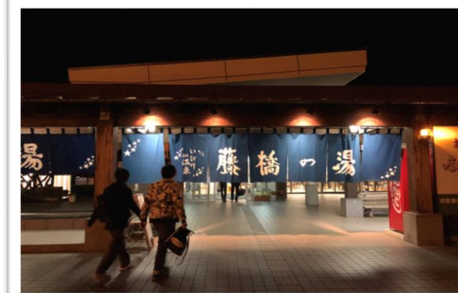
地域の方々と毎日温泉