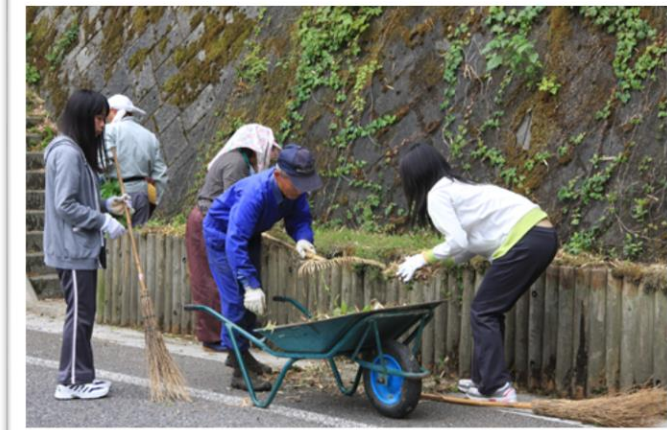
草刈ボランティア