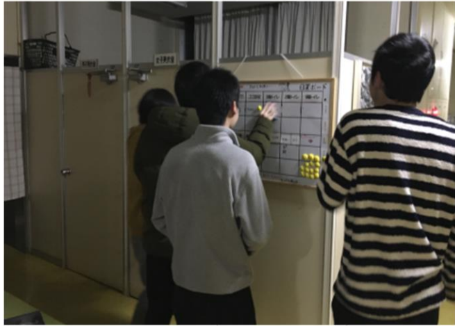
持場を自分で選択