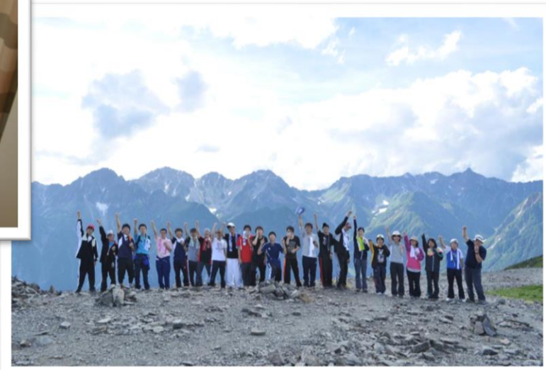
夏山登山 今年で十周年