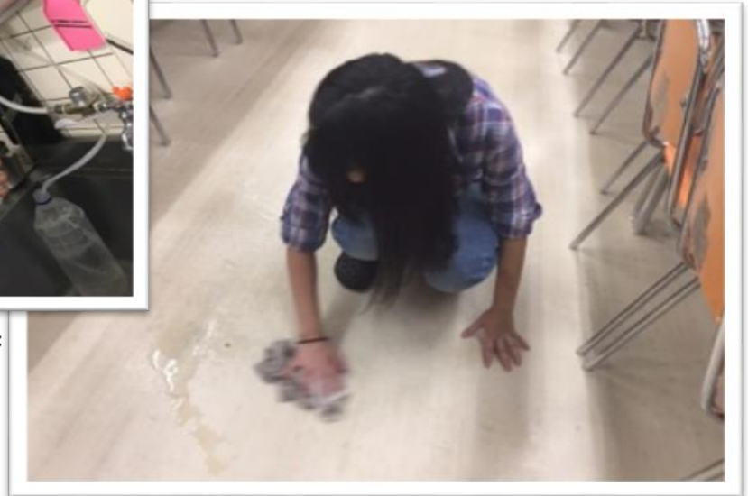
気になったところをきれいに