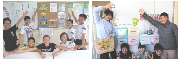
明るい笑顔で元気な「ごかせっ子」！

ア(朝大豆)・ハ(早寝)・ハ(早起き)の笑顔がつくる規則正しい生活習慣を確立し、 みんなで元気な五ヶ瀬の町をつくること、それが学校・保護者・地域の願い です。