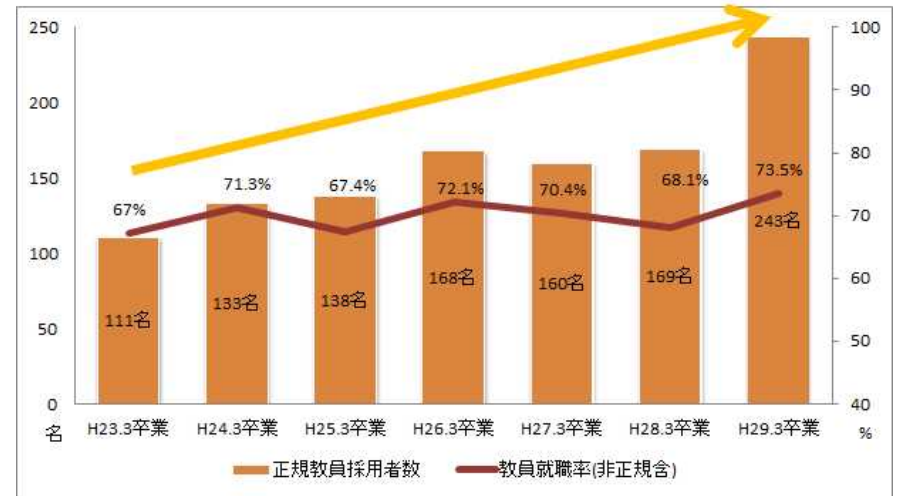
【教育学部(学校教育課程)の教員就職状況】

また、指導教員が学生への就職支援を行うため、学生一人ひとりの教員就職に向けた進路実現のための個表(就職支援カルテ)を作成し、学生本人と指導教員が共有した情報の活用が可能となるようにし、教員採用試験の合格に向けた学生指導を強化した。さらに、就職支援委員会で「就職支援カルテの作成・活用のための仕組みづくり」のワーキンググループを立ち上げ、関連するシステムの運用について調査し、就職支援カルテの活用による指導教員間で面談内容の統一を図り、学生情報の共有による個別指導の質を向上させる「就職支援カルテ運用マニュアル」を作成した。このマニュアルに基づき各指導教員が学生情報総合システムの各データを活用するなどして、個別面談をよりスムーズに進められるよう教員就職指導の体制を整えた。これらの取組の結果、平成28年度の教員採用試験では、平成に入って最高となる正規合格者を出し、正規教員採用者は243名(前年度169名)で、教員就職率は73.5%となった。