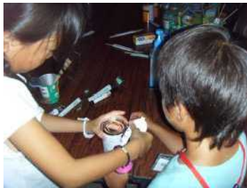
缶切で缶詰を開ける体験