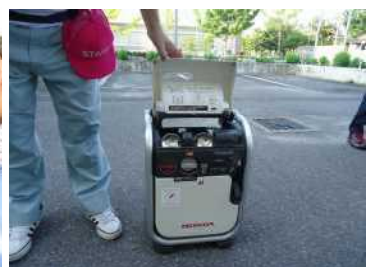
地域所有の電源装置