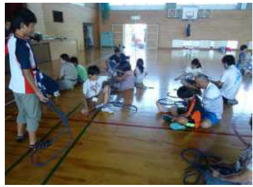
ロープワーク講習