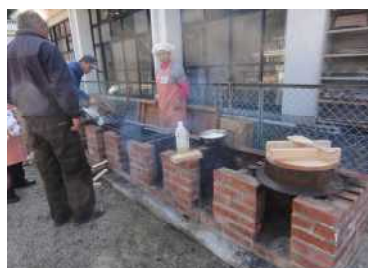
かまどベンチを使った炊き出し