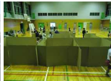
ダンボールでの避難所づく