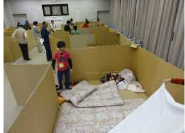
段ボールでの避難所設営