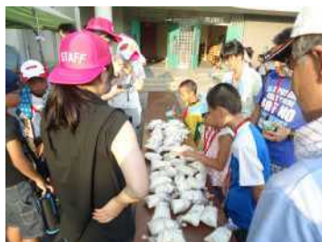
湯煎による炊飯を体験