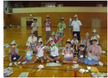
新聞紙での防災グッズ作り