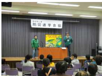
防災紙芝居「いなむらの火」