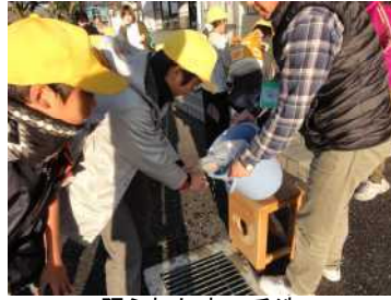
限られた水で手洗い