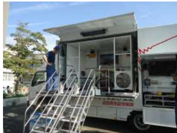
起震車で震度7の揺れを体験