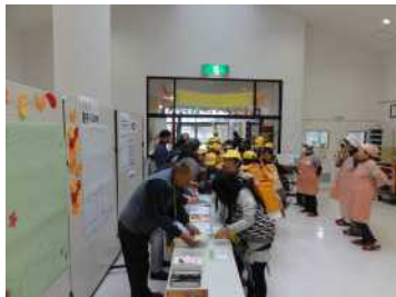
子ども達を地域の方が出迎える