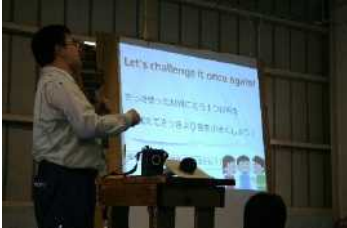
音の仕組みについての講習