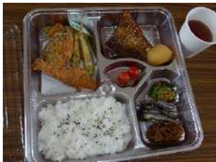
沖島産の食材を使ったお弁当