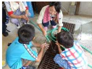
食事前に正しい手の洗い方について学ぶ