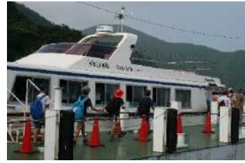
通船に乗って沖島へ