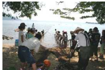
昔ながらの漁法を体験