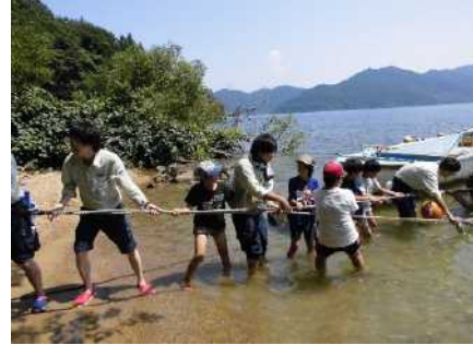
沖島での体験活動(地曳網)