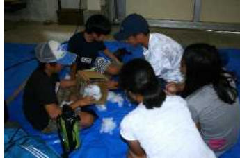
班に分かれて音の小ささを競う