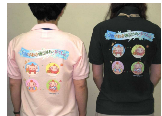
【オリジナルキャラクターを活用したPR】