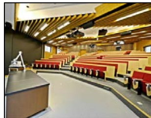
（写真：東工大レクチャーシアター）

③平成26年度に、学生の興味・向上心を喚起する 東工大レクチャーシアター （先端実験講義室）を整備し、本学最先端研究者並びに世界的に著名な発見・発明者を招き、主に初年次の学生を対象に、創造性討論や実験の実演を伴った講義を開講した（講義の開講は平成27年度より）。