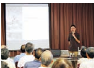
会場一杯の参加者が真剣に耳を傾けていた

展示会場を原資料と写真のコーナーに分け展示。デジタル化資料はスライドショーで映写。期間中に講演会も実施。