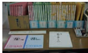
収集した手記のファイル

数少なくなった生存者や古くから在住する人達へ聞き取り調査を行い、約60人の手記の収集ができた。今後とも継続して資料としてまとめていく。