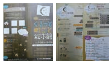
パンフレット（表面・内側の地図）