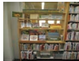
帯広・十勝の本を常設展示

帯広・十勝の「食」に関する資料を収集・展示・貸出し、また、地元開催のイベントなどの情報を発信することで、「地域」と「人」と「食」のつながりを深めていく。