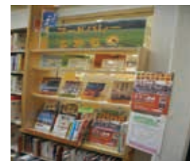
イベントのPRと関連本の展示