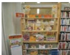
様々なテーマで本を展示

様々なテーマの本を「食☆ナビ」（毎月発行）で紹介。関連本を展示・貸し出すことで、利用者の意識・知識・作る技術を高めてもらう。