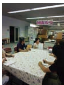
県立図書館での「がん患者サロン」