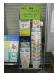
関係団体等から取り寄せたパンフレット