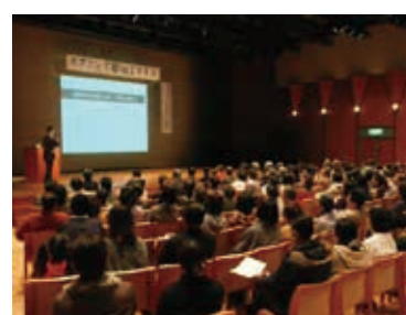
「がん」講演会の開催