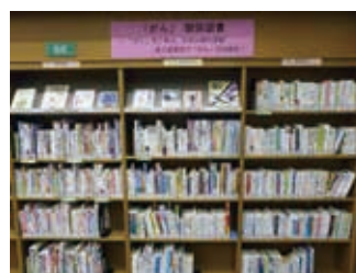
約700冊の「がん」関係図書