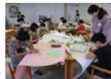
図書館ボランティアは公立小学校教諭