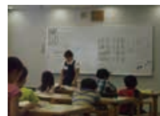
司書による図書館オリエンテーション