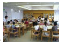
調べ学習の取り組み方を考える