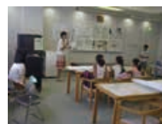
何を使って、どう調べたかを発表