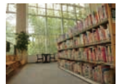
開放的なくらしガーデンコーナー