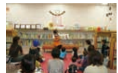
こども図書室でのイベント