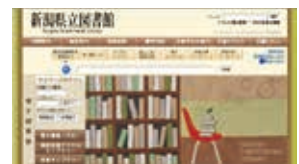
図書館ホームページ

県立図書館・文書館（及び県内市町村）が所蔵する過去400年間の歴史資料3,700点以上をデジタル化した「越後佐渡デジタルライブラリー」ほか、「郷土人物/郷土雑誌記事索引」などを公開。「音楽ライブラリー」等とあわせて、インターネット上でも役立つ・楽しめる図書館を目指す。