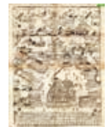
上州草津温泉之図