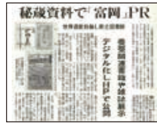
デジタルライブラリー紹介記事

また、図書館未設置町村や学校図書館と連携し、地域や教育現場の実情に配慮した様々な「県内学校図書館支援」事業を展開し、住民や児童生徒の情報格差解消に努めている。