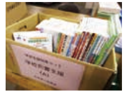
学習支援図書セット