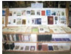
資料展示コーナー