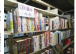
学校図書館図書支援 1000冊プラン用図書